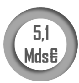
De crédits de paiement en 2022 pour la mission APD

Au sein du projet de loi de finances pour 2023, les crédits de paiement de la mission « Aide publique au développement » se montent à 5,9 milliards d'euros contre 5,1 milliards d'euros en LFI 2022, soit une hausse de 16,04 % .