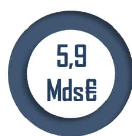
De crédits de paiement en 2023 pour la mission APD

Les crédits du programme 110 « Aide économique et financière au développement » s'élèveront à 3,9 milliards d'euros en autorisations d'engagement (AE) et 2,3 milliards d'euros en CP, en hausse respectivement de 19 % et de 25 %. Le programme 209 atteindra