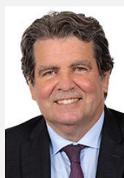
Jean-François RAPIN Rapporteur spécial Sénateur (Les Républicains) du Pas-de-Calais