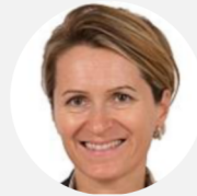
Anne-Catherine Loisier Rapporteure Sénatrice de la Côte-d'Or (ratt. Union Centriste)

COMMISSION DES AFFAIRES ÉCONOMIQUES http://www.senat.fr/commission/affaires_economiques/index.html