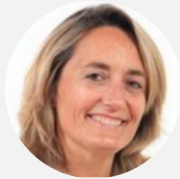
Sophie Primas Présidente Sénateur des Yvelines (Les Républicains)