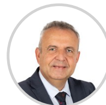
Laurent BURGOA Rapporteur Gard Les Républicains