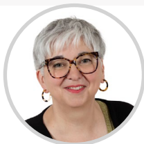
Muriel JOURDA Président Morbihan Les Républicains