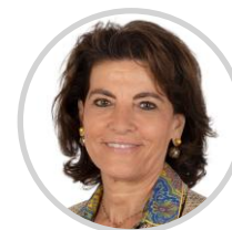
Dominique ESTROSI SASSONE Présidente Alpes-Maritimes Les Républicains