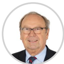
Pierre CUYPERS Rapporteur Seine-et-Marne Les Républicains