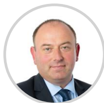
Laurent DUPLOMB Rapporteur Haute-Loire Les Républicains