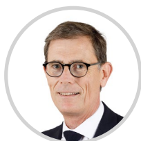
Laurent LAFON Président Val-de-Marne Union Centriste