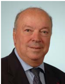
Jean-Pierre Door, Député du Loiret