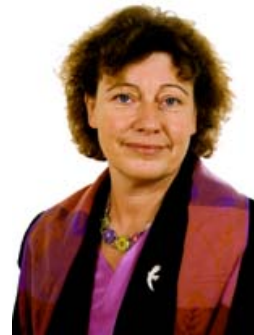
Marie-Christine Blandin, Sénatrice du Nord

Mardi 1er Décembre 2009 de 9 h à 18 h 30 à l'Assemblée nationale Salle Lamartine 101, rue de l'Université - Paris 7 ème