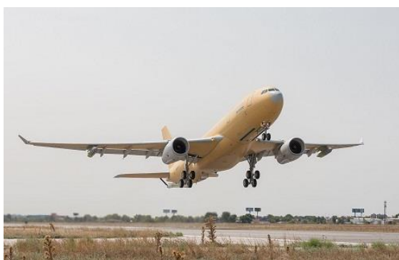
MRTT (Multi Role Tanker Transport) Phénix

Ces crédits permettront notamment de préparer l'accueil du sous-marin nucléaire d'attaque ( SNA) Barracuda , de l'avion de transport et de ravitaillement MRTT et du véhicule Scorpion .