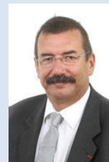
M. Gilbert Roger sénateur de Seine-Saint-Denis

Le rapport complet est disponible sur le site du Sénat : http://www.senat.fr/rap/a17-110-7/a17-110-7.html