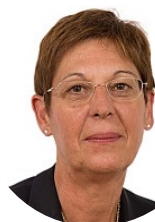
Chantal Deseyne Sénateur (LR) d'Eure-et-Loir Rapporteur pour avis

http://www.senat.fr/dossier-legislatif/pjl21-327.html