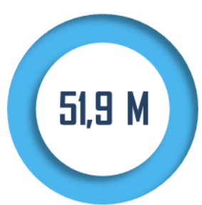
Nombre de personnes présentant un schéma vaccinal complet

Si la population française est très largement vaccinée, la commission rappelle que des inégalités persistent , sur le plan géographique, avec des taux beaucoup plus bas outre-mer, mais aussi un gradient social qui demeure.