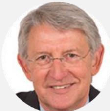
Yannick Vaugrenard Rapporteur Sénateur de Loire Atlantique (SER)

Consulter le rapport : http://www.senat.fr/rap/a22-117-5/a22-117-5.html