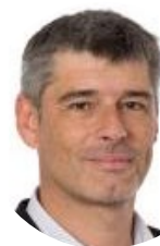
Guillaume GONTARD Rapporteur Sénateur de l'Isère (EST)