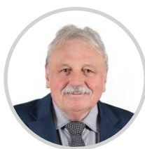
Jean-François LONGEOT Président Doubs Union Centriste