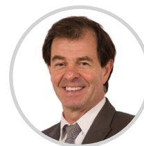
Jacques GOSPERRIN Rapporteur Doubs Les Républicains