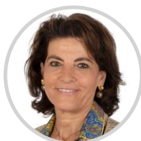
Dominique ESTROSI SASSONE Président Alpes-Maritimes Les Républicains