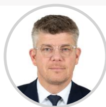
Cédric PERRIN Président/Rapporteur Territoire de Belfort Les Républicains