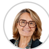
Sophie PRIMAS Rapporteuse Yvelines Les Républicains