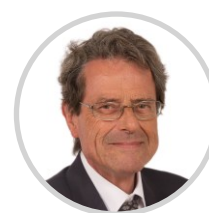
Alain MILON Rapporteur Vaucluse Les Républicains