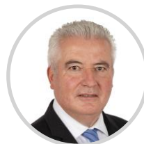
Jean-Claude ANGLARS Rapporteur Aveyron Les Républicains