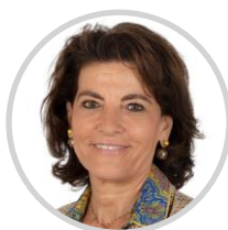
Dominique ESTROSI SASSONE Présidente Alpes-Maritimes Les Républicains