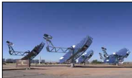
Concentrateurs solaires à Sandia (Nouveau Mexique)

C'est une des raisons pour lesquelles les préoccupations de la société exprimées à l'occasion du Grenelle de l'environnement ont pu trouver un relais rapide du côté de l'effort de recherche, ainsi qu'en témoigne le déploiement des démonstrateurs dans le domaine clef des biocarburants. De fait, l'effort pour développer des