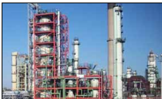
Unité de transformation thermochimique de biomasse à Porvoo (Finlande)