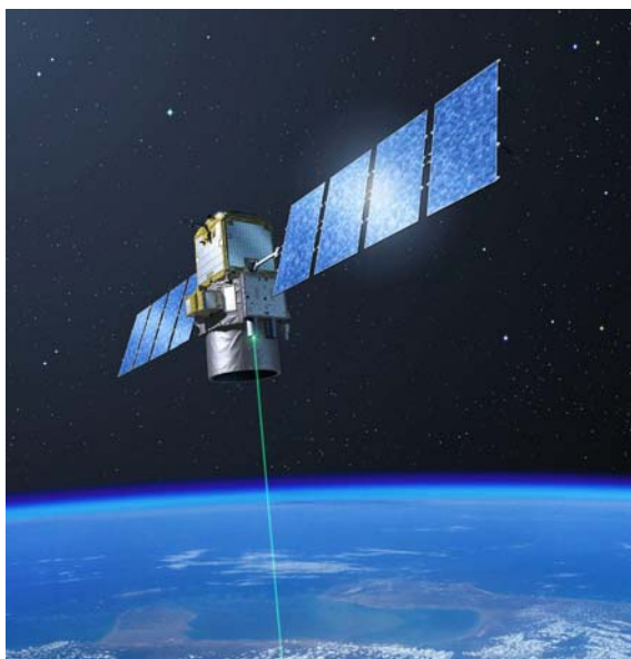
Calipso, la position verticale du panache grâce au lidar

100 000 le nombre des décès en Europe des suites indirectes de cette éruption.