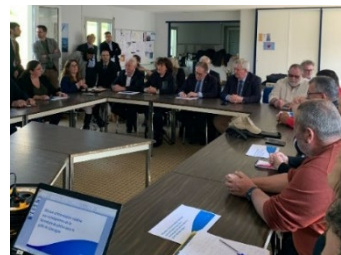
Réunion de la Présidente et des rapporteurs de la commission au Croisic avec des scientifiques d'Ifremer, des représentants des pêcheurs et les services de l'État

La société a assumé une double dépense : moindre création de richesse d'une part, et coût de l'indemnisation de l'autre (sans compter les ressources administratives déployées et les inévitables effets de bord des indemnisations).