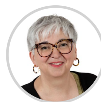
Muriel JOURDA Présidente de la commission des lois Morbihan LR