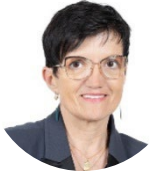
TABLE RONDE « NOUVELLE STRATÉGIE EUROPÉENNE EN MATIÈRE D'ÉGALITÉ ENTRE LES FEMMES ET LES HOMMES : QUELS OBJECTIFS ? QUELLE DÉCLINAISON NATIONALE ET TERRITORIALE ? »

Sous la présidence de Guylène PANTEL Vice-Présidente de la délégation aux droits des femmes et à l'égalité des chances entre les hommes et les femmes