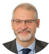
TABLE RONDE « la Charte européenne, un outil politique et programmatique au service de l'égalité entre les femmes et les hommes »