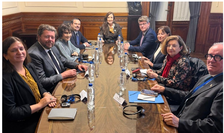
Rencontre avec Mme Victoria VILLARUEL, Vice-présidente de la Nation argentine et Présidente du Sénat

Les résultats enregistrés semblent positifs : croissance de 4,4 % en 2025, inflation retombée à 32 % en 2026, taux de pauvreté en recul à 28,2 % mi-2025. Ces chiffres ne doivent toutefois pas occulter plusieurs