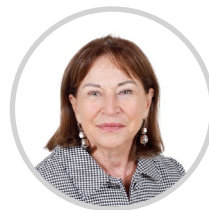
Catherine DUMAS Rapporteuse Paris Les Républicains