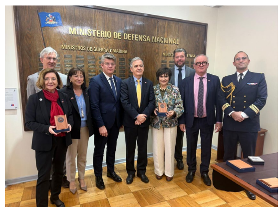
Rencontre avec M. Rodrigo ÁLVAREZ, secrétaire d'État à la défense

Au plan sociétal, plusieurs annonces ont suscité des préoccupations quant à la protection des droits de l'homme et à la continuité des politiques de mémoire engagées sous l'administration précédente.