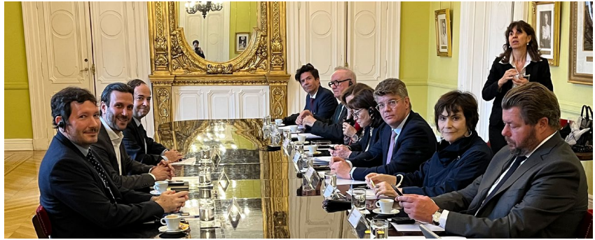
Rencontre avec M. Ignacio DEVITT, Secrétaire aux affaires stratégiques de la Présidence de la Nation

L'Europe est considérée par l'exécutif argentin comme un partenaire important. L'accord entre l'Union européenne et le Mercosur fait ainsi l'objet d'un large soutien au plan politique. Celui-ci a été présenté par les autorités argentines comme un instrument susceptible de renforcer les relations économiques entre les deux blocs.