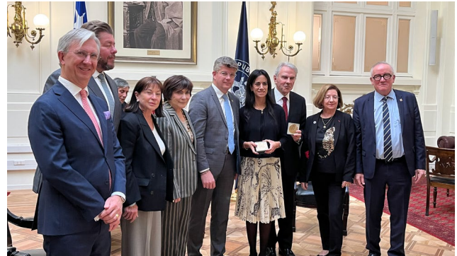
Rencontre avec Mme Paulina NÚÑEZ, Présidente du Sénat, et M. Iván MOREIRA, Vice-président du Sénat

Les performances économiques du Chili coexistent cependant avec la persistance d'inégalités sociales. Le coefficient de Gini atteignait ainsi 0,45 en 2022, soit un niveau plus élevé que dans la plupart des pays de l'OCDE.