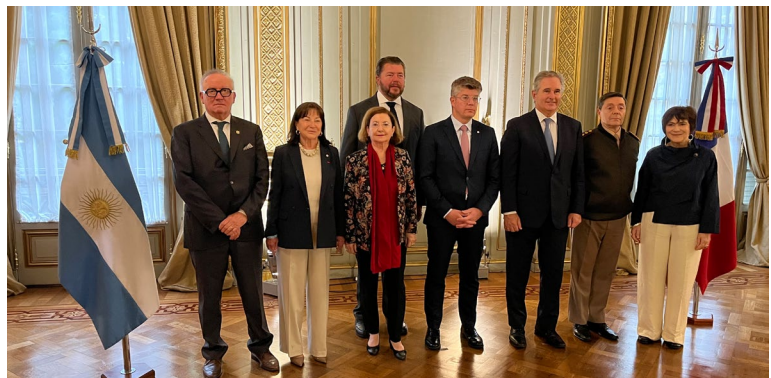
Rencontre avec MM. Pablo QUIRNO, Ministre des relations extérieures, du commerce international et du culte, et Carlos PRESTI, Ministre de la défense

traduite par plusieurs décisions concrètes, au premier rang desquelles le retrait de l'Argentine de l'OMS. Par ailleurs, les autorités argentines appréhendent désormais les enjeux climatiques principalement sous l'angle du développement économique et de l'attractivité des investissements. Le maintien de l'Argentine dans l'Accord de Paris était ainsi une condition pour que l'accord UE-Mercosur puisse entrer en vigueur. De même, la réforme de la loi de 2010