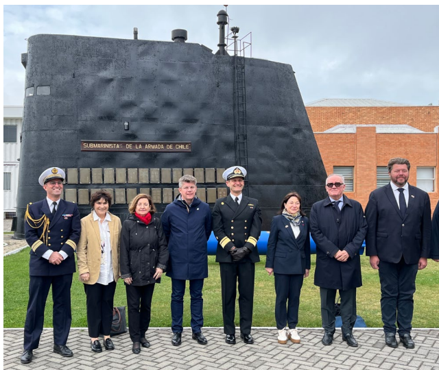
Visite de la base navale de Talcahuano

Les entreprises françaises occupent des positions importantes dans des secteurs stratégiques tels que les infrastructures, les transports, l'énergie, l'environnement, les services ou encore l'industrie.