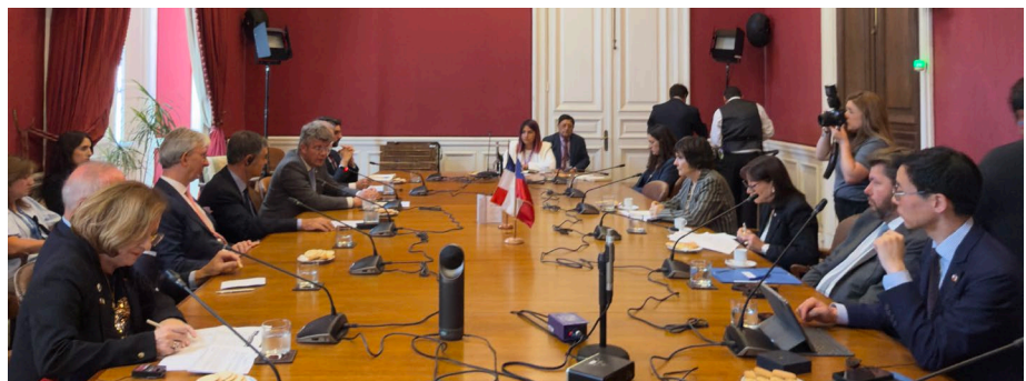
Rencontre avec M. Manuel José OSSANDÓN, Président de la commission des relations extérieures du Sénat et ancien Président du Sénat

Élu président le 14 décembre 2025 avec 58,2 % des voix, José Antonio Kast, candidat de la droite radicale, a fait de la sécurité intérieure, de la maîtrise de l'immigration et de l'approfondissement de la libéralisation économique les priorités de son mandat.