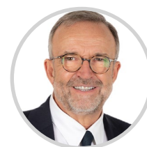
Étienne BLANC Rapporteur Rhône Les Républicains