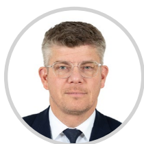
Cédric PERRIN Président Territoire de Belfort Les Républicains