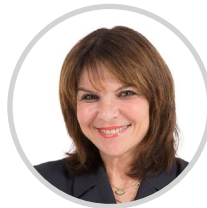
Nathalie GOULET Rapporteur spécial Orne Union Centriste