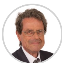
Alain MILON Président de la Mecss Rapporteur Vaucluse Les Républicains