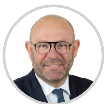
Philippe MOUILLER Président de la commission Deux-Sèvres Les Républicains